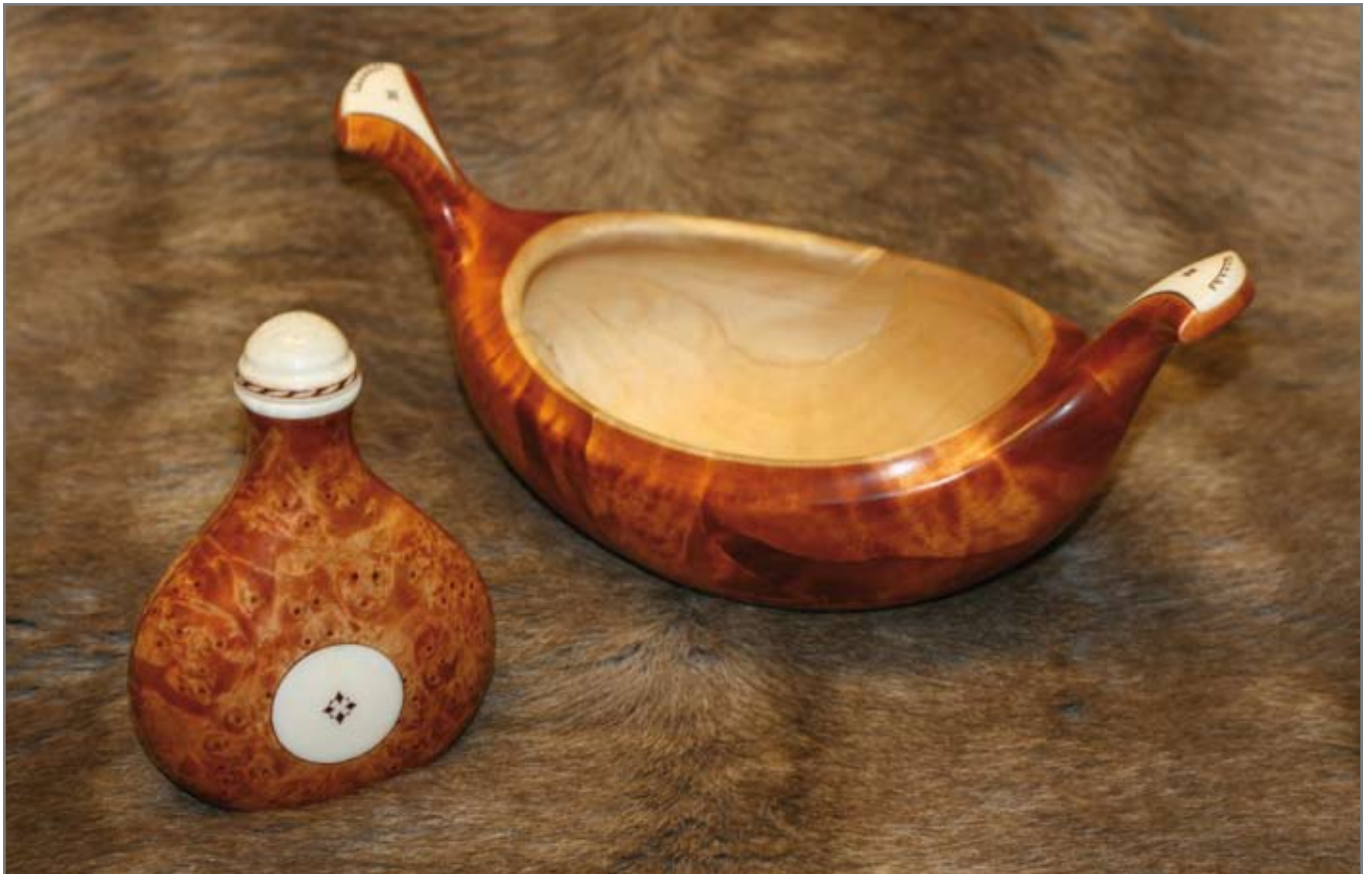
Saltströare och skål av Martin Kuorak, Jokkmokk.